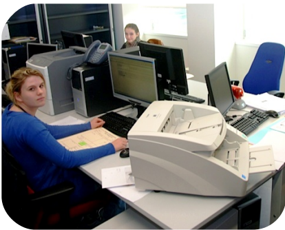
Quelques membres de l'équipe JustScan du tribunal de 1 re instance de Bruxelles

Dans le même temps, des sessions d'informations seront organisées dans les arrondissements qui se sont déclarés intéressés auprès du SPF Justice. Pas moins d'une vingtaine de sessions prendront place d'ici à la mi-novembre. Ces sessions, destinées aux magistrats et à leurs collaborateurs, sont organisées par le service d'encadrement ICT du SPF Justice avec la participation de la CMOJ. Au programme : description du projet, enjeux et obstacles, démonstration, projection d'un film et visite sur site.