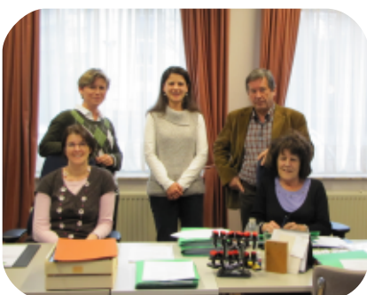
De equipe van de vrederecht te Fléron